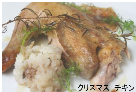
クリスマス チキン