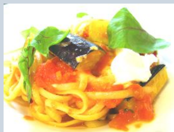
ランチ パスタランチ

たか倉では、6月中旬にディナーメニューを大幅に変更しました。 新たに「プリティクスコース」という “お客様にお好きな料理をお選び頂けるコース”を追加したほか、 アラカルト、ドリンクメニューなども一新し、 今までよりも更に素敵なお時間を楽しんで頂けるようになりました。