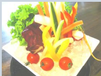
ディナーアラカルト 農園のバーニャカウダ